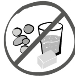
Le mauvais sucre